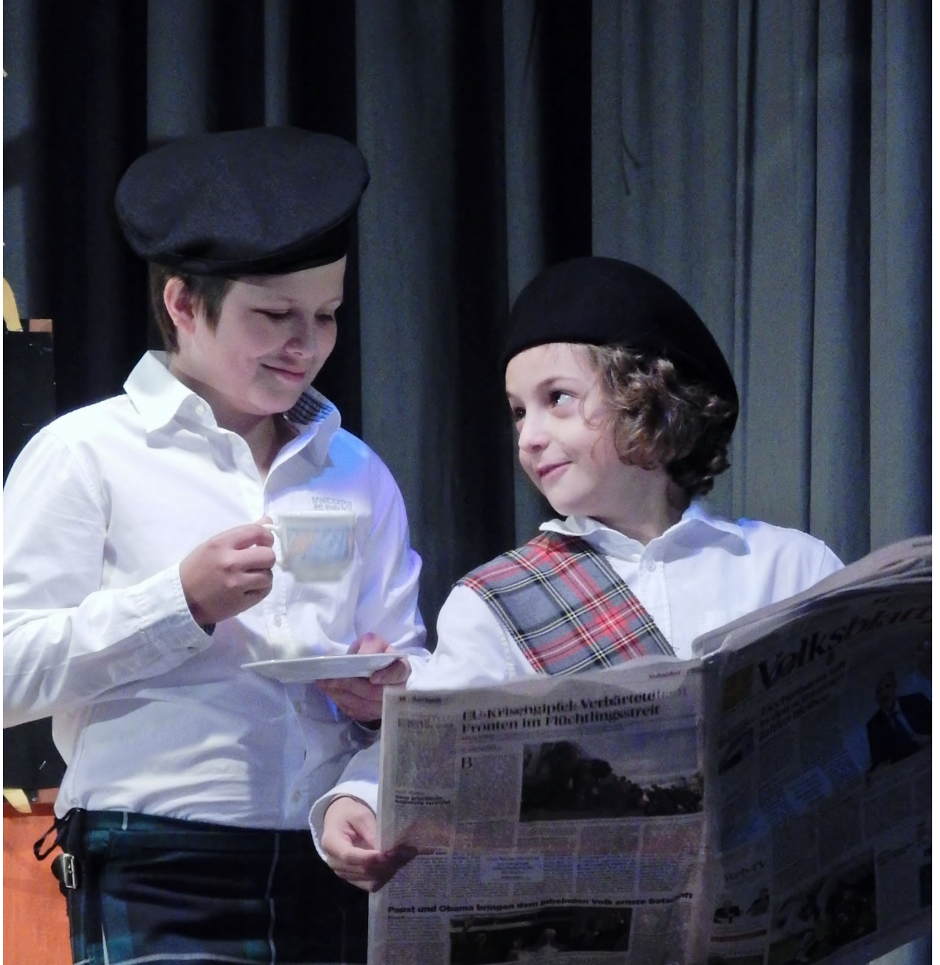
Investitionen im Bildungsbereich bringen erstaunliche Talente zu Tage.